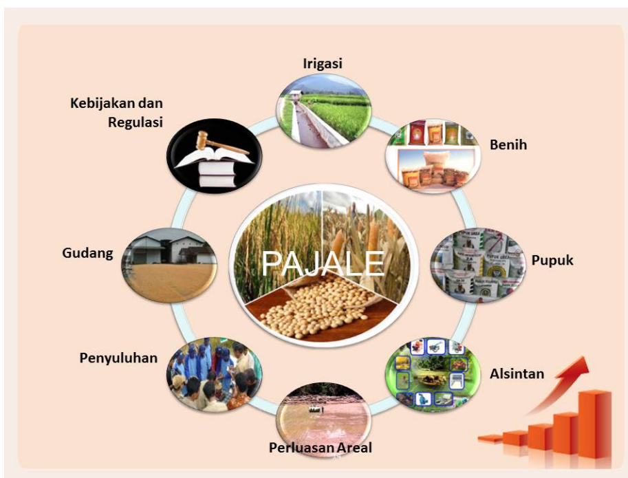
Gambar 1. Lay out Upsus Pajale